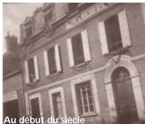
Au début du siècle

À l'époque, les opérations sont réalisées aussi bien dans l'enceinte de la clinique qu'au domicile des patients.